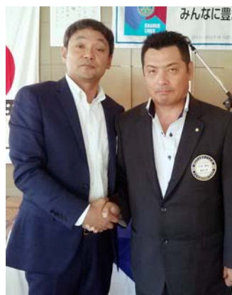
新旧会長・幹事バッジ交換